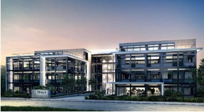
Programme ONYX | Annecy-le-Vieux, Parc des Glaisins