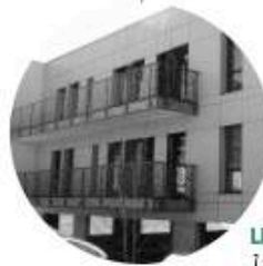
LE LAUDON | Annecy-le-Vieux 1598 m 2 (div. 100 m 2 ) Livraison 12 mois après signature