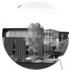
Les PORTES DU PIEMONT | Poisy 2190 m 2 (div. 80 m 2 ) Livraison 2nd semestre 2017