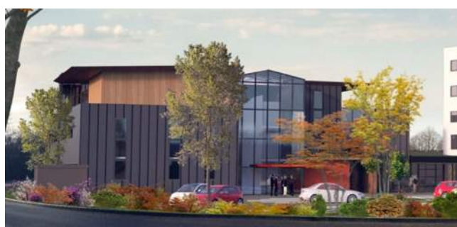
Programme LES PORTES DU PIEMONT | Poisy