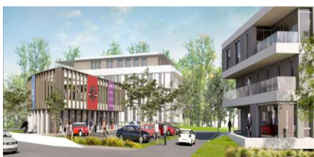
Programme LES CREUSETTES | Poisy