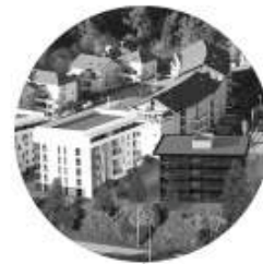
Les ILETTES | Annecy Nord 1864 m 2 (div. 300 m 2 ) Livraison 2nd semestre 2017